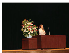
講演 谷本 歩実氏

一言氏からは、前職のスポーツ庁で関わったスポーツ施設の総合的な施策の説明や「大田区の地域資源とアイデア」という区民にとっても身近な内容を提言され、最後にオリンピック・パラリンピックに向けて、また区の将来に向けて、「アイデアの萌芽」で「スポーツタウンおおた」を目指してほしいとの期待の言葉をいただきました。