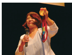
金メダルを披露する谷本 歩実氏