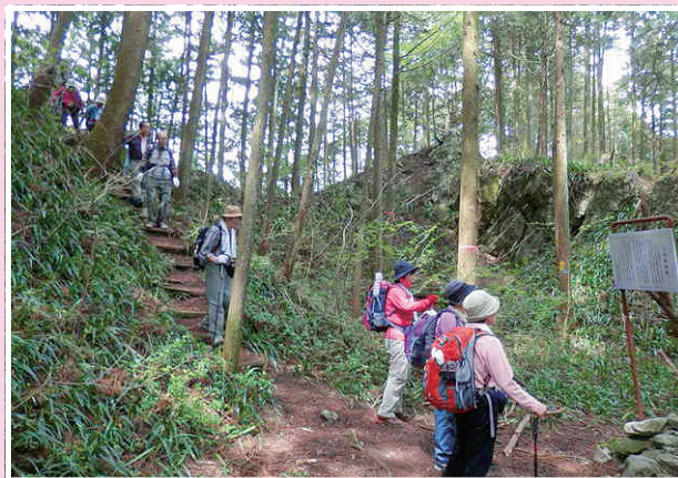
辛垣城(からかいじょう)のいわれを真剣に勉強中 ※辛垣城は、東京都青梅市にある城址。

自然への憧れは誰でもが感じ、その喜びを体験することなのですが、自然と親しみ、生活にうろおいのある野外活動を、安全で広く区民の楽しい「生涯学習」の場としてお世話してまいります。「私達は日の光を浴び、自然に親しむことをモットーとしています」