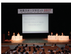
シンポジウム 全景