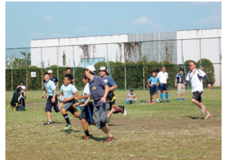
森が崎運動公園広場タッチ&タグラグビー