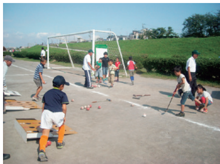
多摩川サッカー場ゲートボール体験教室