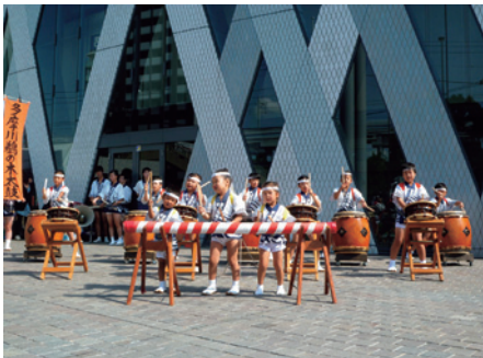
大田区総合体育館 多摩川鶉の木太鼓