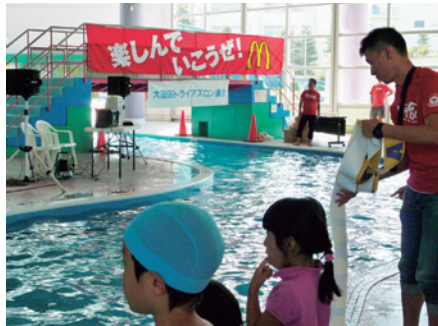
菖中公園プール アクアスロン大会