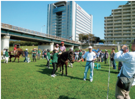
ガス橋緑地 こども乗馬