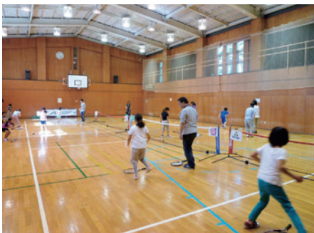
大森地区会場 親子でぶらっとテニス体験