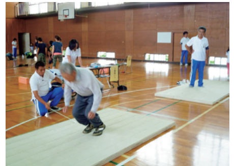
出雲中学校 体力測定