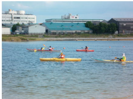
大森ふるさとの浜辺公園カヌー体験教室