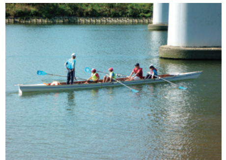
多摩川ガス橋付近 ボート教室