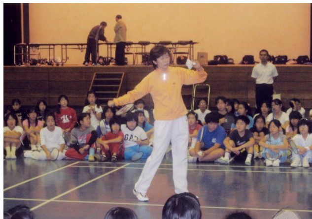
森講師による基本打法の実技指導

今回の催しでは、中学校のバドミントン部員が、審判や指導のお手伝いを積極的に担い、運営を助けてくれました。ありがとうございました。