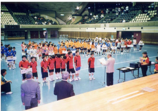
表彰式での「相生ガキーズ」選手たち