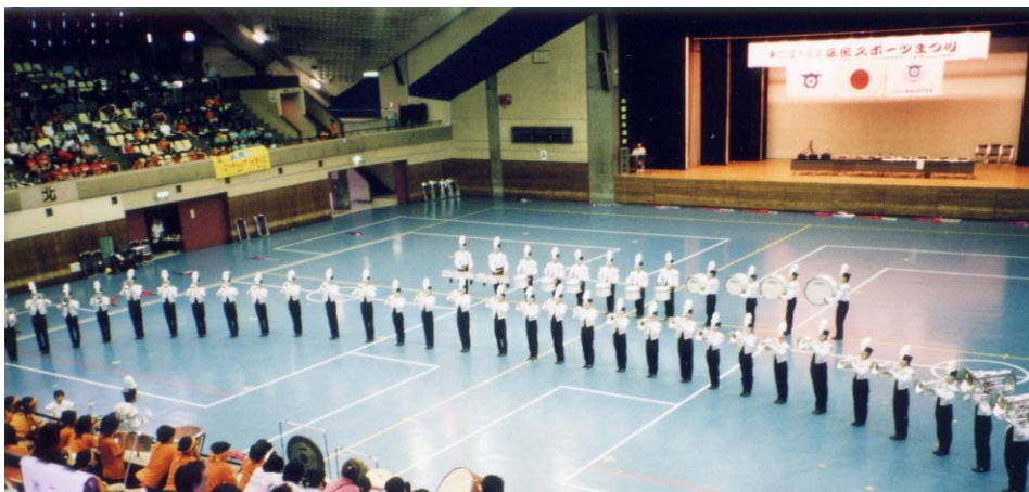
閉会式でのマーチングドリル(東京実業高校フェニックス・レジメント)