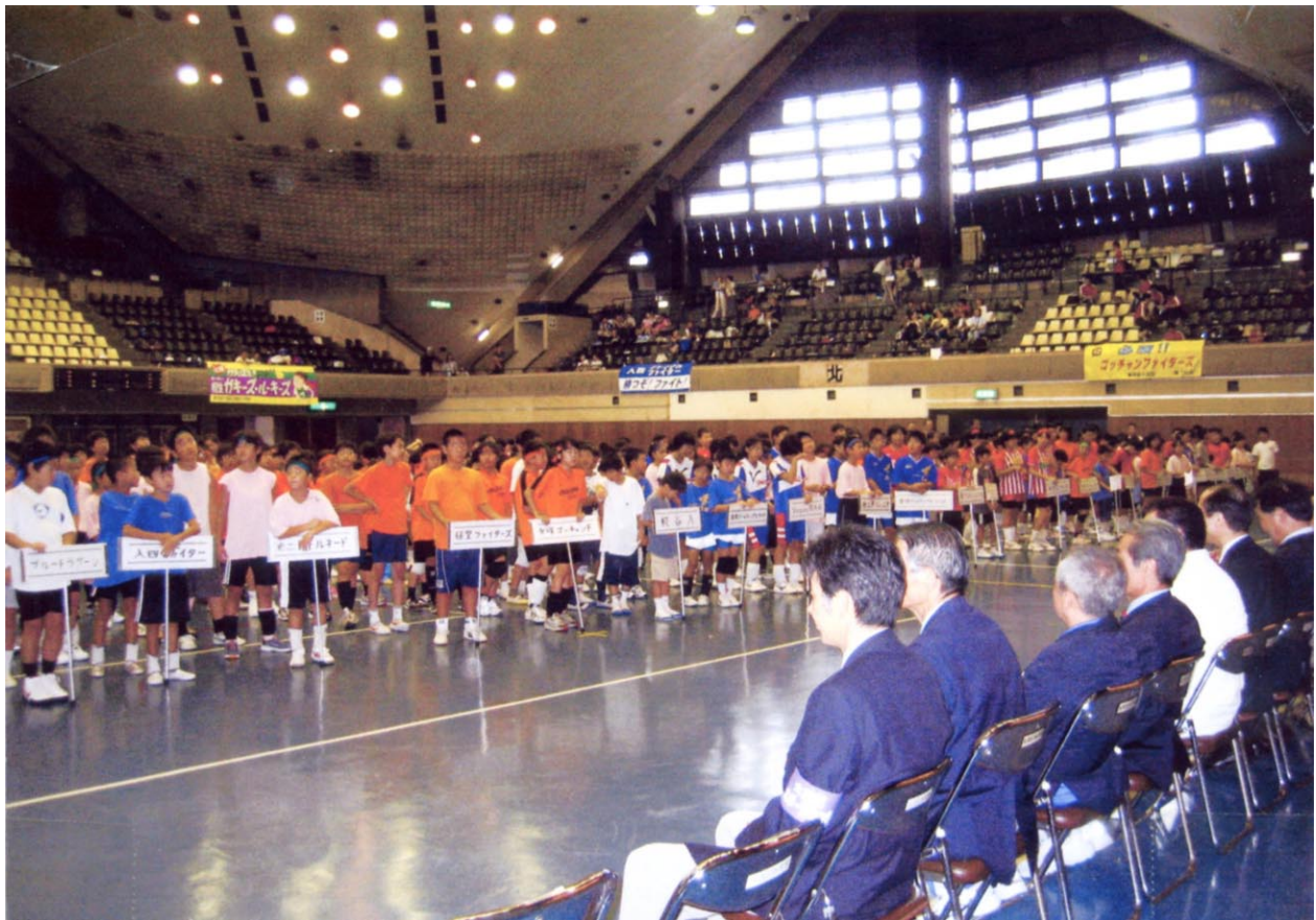
ドッチボール大会参加の選手たち - 区民スポーツまつり開会式 -

平成16年度、大田区体育協会の事業計画・予算が3月16日の理事会及び22日の評議会で可決されました。16年度予算は、昨年度に引き続く厳しい財政状況の中で、財源をより有効に活用する予算となっています。