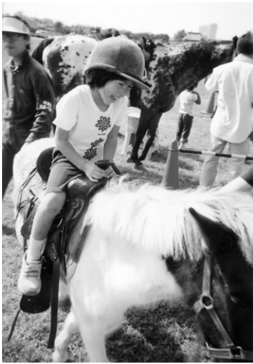
かわいいね(乗馬体験)

10月14日の体育の日(一部10月20日開催)に、大田区区民スポーツまつりが行われました。昨年と同様、身近な区民施設・民間施設を活用したまつりには、1万2千7百人が参加し、楽し