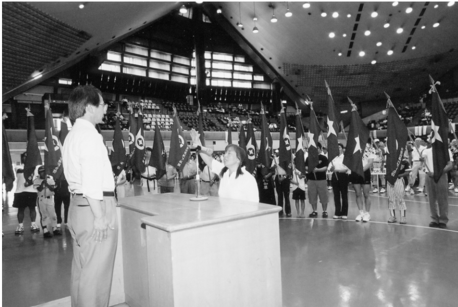
全選手を代表して力強い選手宣誓！ - 区民大会開会式 -

平成15年度の実業計画・予算案が、理事会・評議員会で議決されました。今年度は、前年度に引き続く財政状況の中で、事業・管理経費の見直しを行うなど、財源を有効に活用する事業計画・予算になっています。