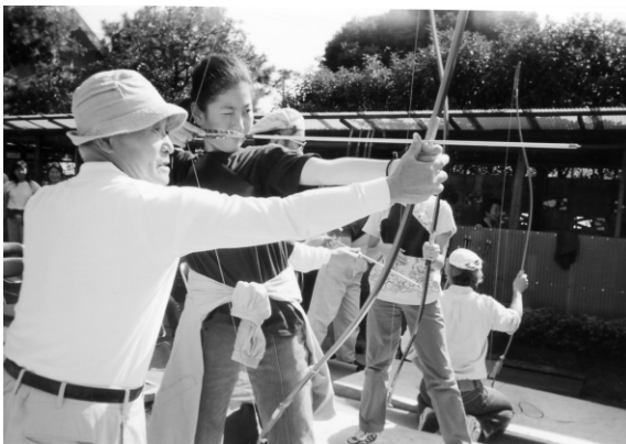
集中(和弓での的当て)