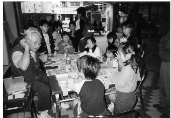
竹とんぼを作ろうよ(池上交流会)