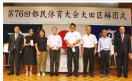
準優勝チームのみなさん (女子ゴルフ/馬術/女子ボウリング/ 女子スキー/女子テニス/軟式野球/男子陸上)