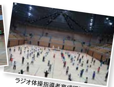
ラジオ体操指導者育成講習会