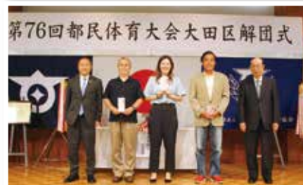
第3位入賞チームのみなさん (男子ゲートボール/男子テニス/女子フェンシング/ 男子水泳/男子弓道/女子バレーボール/ 男子ハンドボール/男子アーチェリー)