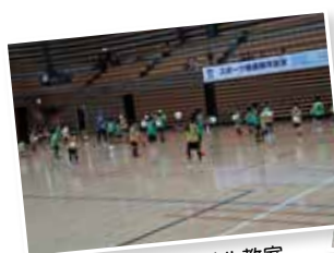
子どもフットサル教室