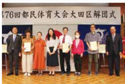
優勝チームのみなさん (女子卓球/ダンススポーツ/男子ボウリング)