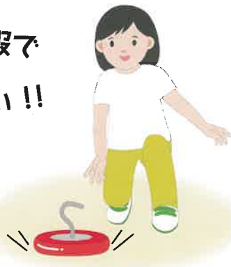
フロアカーリング