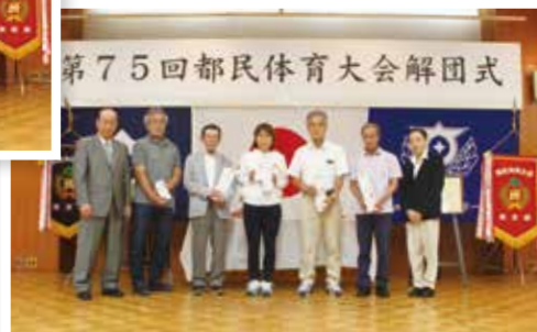
第3位入賞チームのみなさん