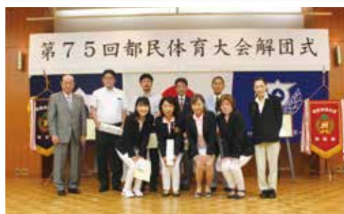
優勝チームのみなさん