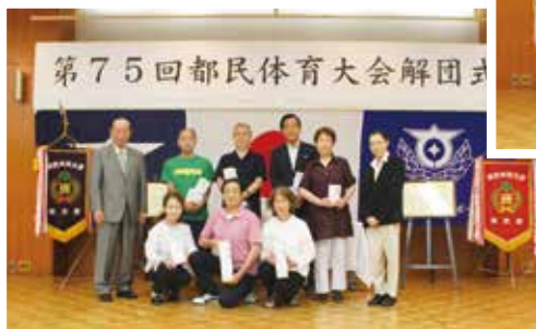
準優勝チームのみなさん