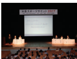
シンポジウム 全景