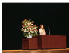
講演 谷本 歩実氏

一言氏からは、前職のスポーツ庁で関わったスポーツ施設の総合的な施策の説明や「大田区の地域資源とアイデア」という区民にとっても身近な内容を提言され、最後にオリンピック・パラリンピックに向けて、また区の将来に向けて、「アイデアの萌芽」で「スポーツタウンおおた」を目指してほしいとの期待の言葉をいただきました。