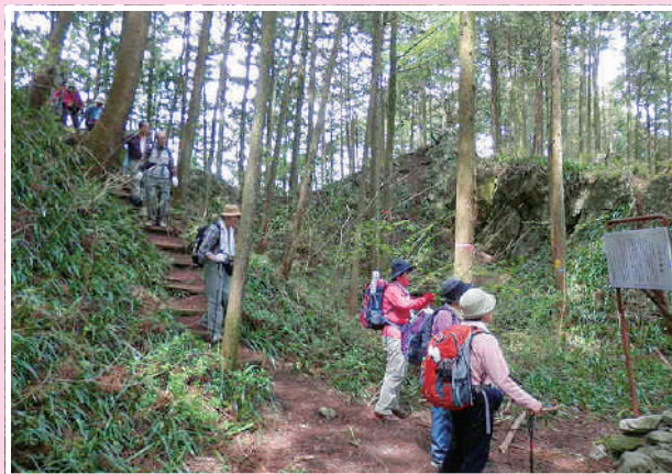
辛垣城(からかいじょう)のいわれを真剣に勉強中 ※辛垣城は、東京都青梅市にある城址。

自然への憧れは誰でもが感じ、その喜びを体験することなのですが、自然と親しみ、生活にうるおいのある野外活動を、安全で広く区民の楽しい「生涯学習」の場としてお世話してまいります。「私達は日の光を浴び、自然に親しむことをモットーとしています」