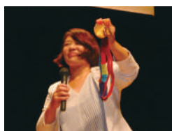
金メダルを披露する谷本 歩実氏